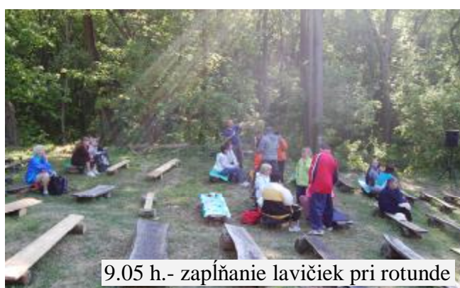
9.05 h.- zapĺňanie lavičiek pri rotunde