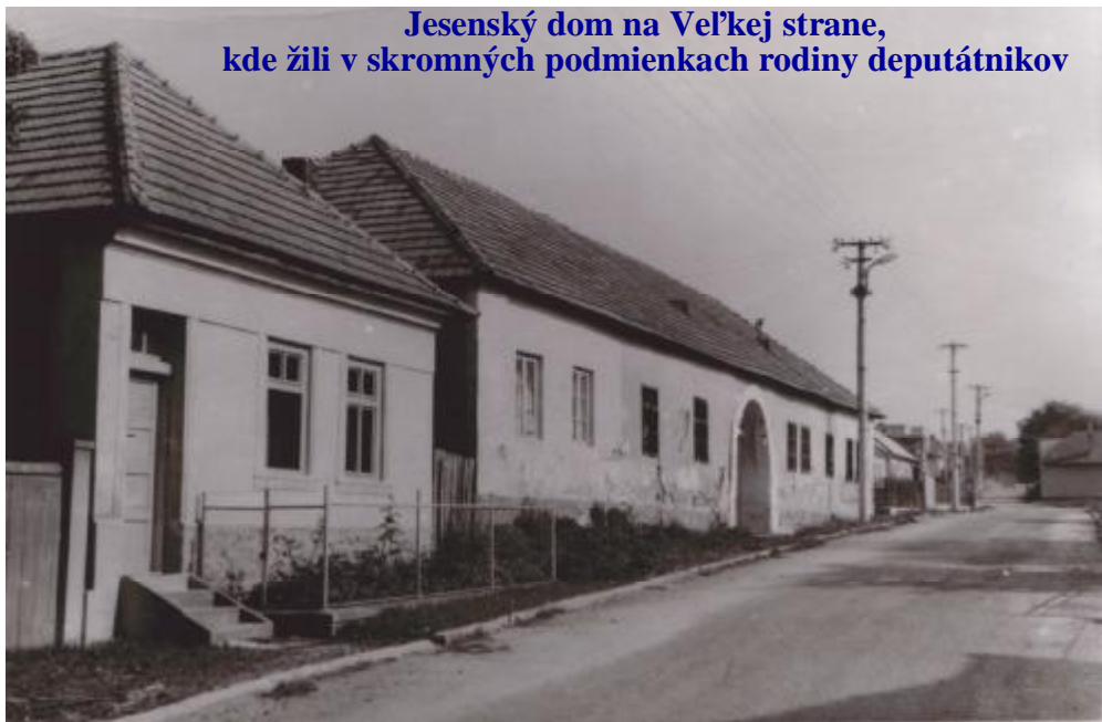
Jesenský dom na Veľkej strane, kde žili v skromných podmienkach rodiny deputátnikov