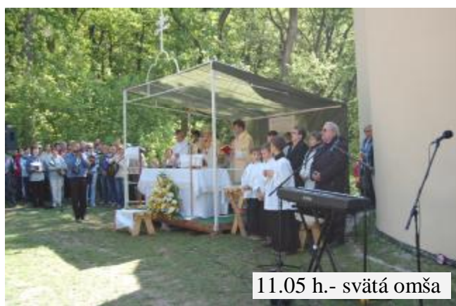
11.05 h.- svätá omša