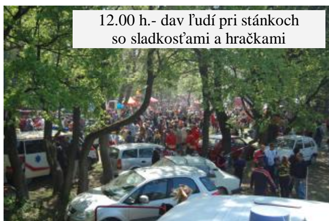
12.00 h.- dav ľudí pri stánkoch so sladkosťami a hračkami