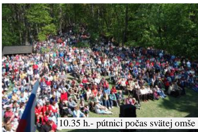
10.35 h.- pútnici počas svätej omše