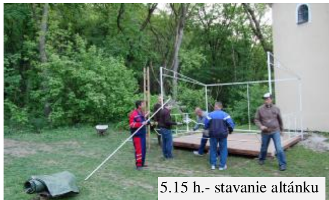
5.15 h.- stavanie altánu