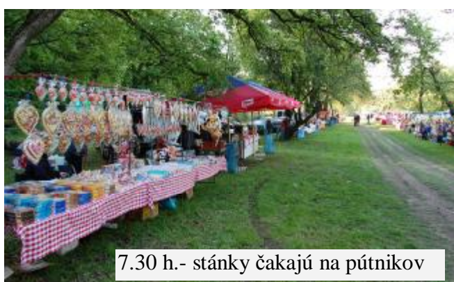
7.30 h.- stánky čakajú na pútnikov