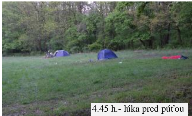
4.45 h.- lúka pred púťou

Tradičná aprílová svätojurská púť prilákala aj v tomto roku tisíce ľudí. Hlavným celebrantom svätej omše bol Mons. ThDr. Ladislav Belás, kanonik, opát. Krásne počasie prialo pútnikom, rodinným i priateľským stretnutiam. Ponúkame vám zopár záberov z 26. apríla 2009, ktoré nám poskytol Martin Prekop.