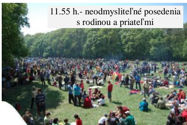
11.55 h.- neodmysliteľné posedenia s rodinou a priateľmi