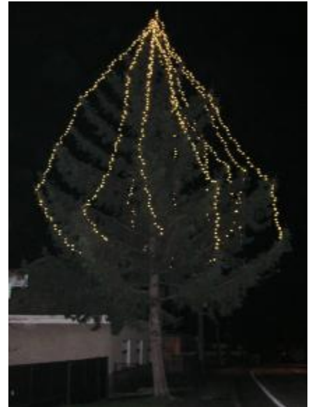
Náš vianočný strom 2007

Áno, prelom rokov je časom bilancovania. Hodnotíme každý osobne, bilancujú rodiny, firmy, spoločenstvá, obce, štáty. Možno niekedy vzniká otázka, či vlastne má zmysel hodnotiť, či je rozumné dívať sa aj dozadu, veď jediné, čo o čase vieme s istotou povedať, je ten nemenný fakt, že plynie len smerom dopredu. Svoje hodnotenie, svoju vnútornú bilanciu si každý človek vedomky či nevedomky robí sám. Na bilanciu firiem či inštitúcií slúžia výročné správy. Aj miestna samospráva sa snažila v priebehu roku zabezpečovať úlohy vyplývajúce zo zákona o obecnom zriadení a plánu hlavných úloh obce. A tak na tomto malom priestore – skúsme sa len v krátkosti pozrieť trochu späť a